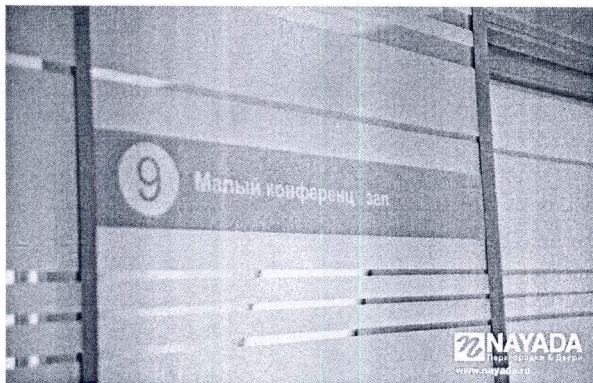
Рис1. Образцы пленки и типа оклейки